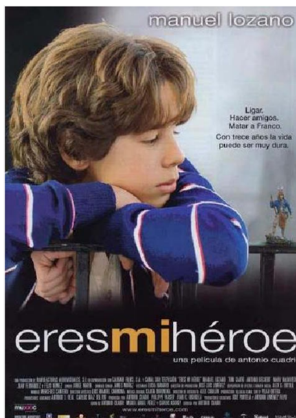
Eres mi héroe (2003) de Antonio Cuadri

Estos jóvenes se angustiaron con La Zona ; el curso anterior compararon su vida y experiencia escolar con la de los internos en Fuerte Apache ; ya habían visto y casi protagonizado Eres mi héroe , con el añadido de que en sus centros desde las tutorías se trabaja con el programa “Cine y Salud”, y en algunos casos en su etapa de escuela habían participado en “Aula de Cine”, también del Dpto. de Educación. Fue gratificante, como la guinda de la tarta, esa sesión del pasado mayo, la penúltima, donde la mano alzada