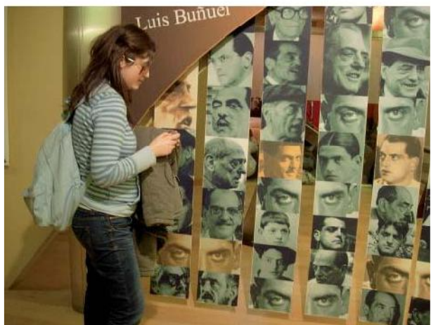
Logo de “Un Día de Cine” y Filmoteca, cartel de fotos de Buñuel