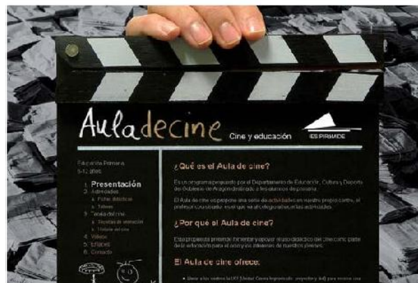
Marca páginas de “Aula de Cine” y página Web del Programa

los valores y modos de vida que asumen nuestros alumnos y alumnas y que se ha convertido en la forma de expresión más popular de nuestra época. Igualmente trata de fomentar y apoyar el uso didáctico del cine en las aulas para ayudar a los alumnos a reflexionar y analizar la información proveniente de los Medios Audiovisuales, principal fuente de información y comunicación de los niños y niñas en edad escolar.