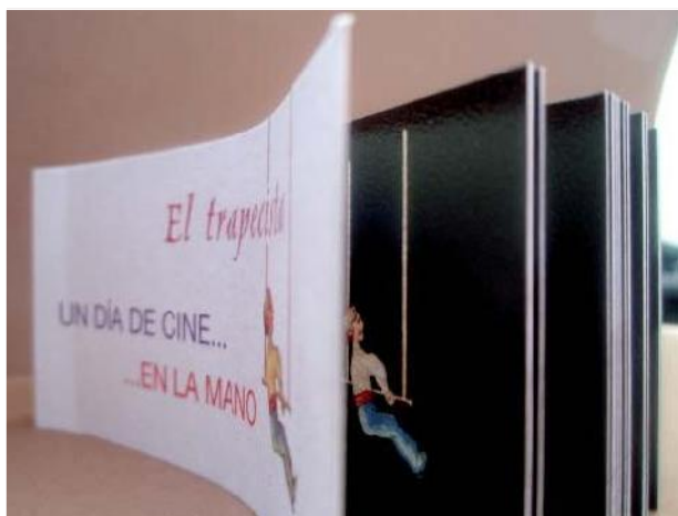
Flipbook de un trapecista realizado en el 10º aniversario de "Un Día de Cine"

Dibujarlas es un trabajo de gran precisión y diseñarlas de gran imaginación.