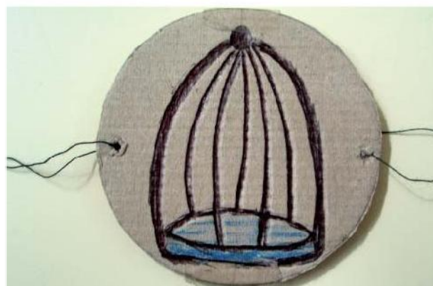
Caras de un taumátropo